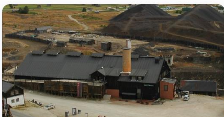
Inngangsbillett Rørosmuseet Smelthytta