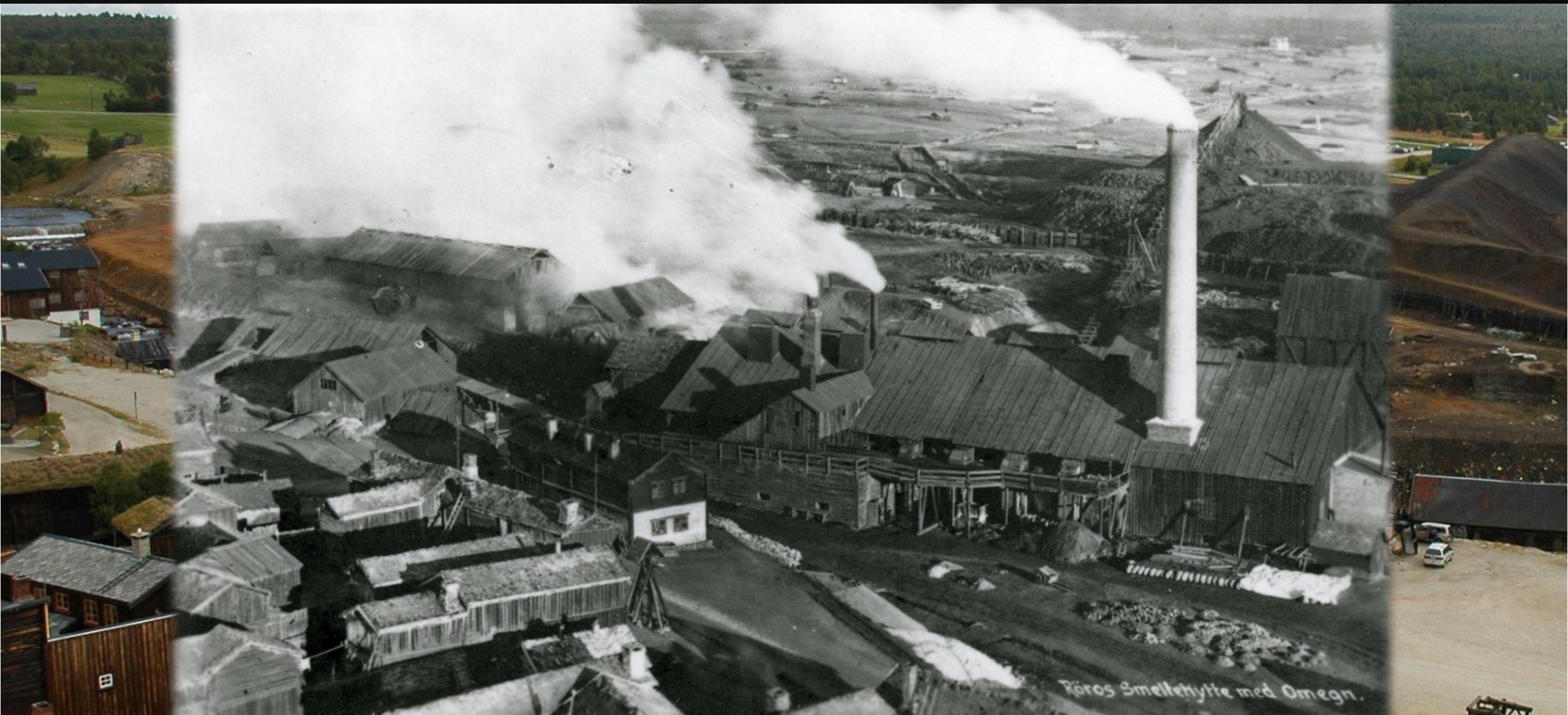
Roros Smeltehytte med Omegn.