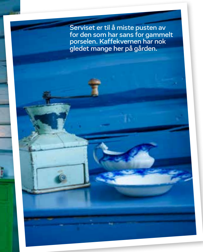
Serviset er til å miste pusten av for den som har sans for gammelt porselen. Kaffekvernen har nok gledet mange her på gården.