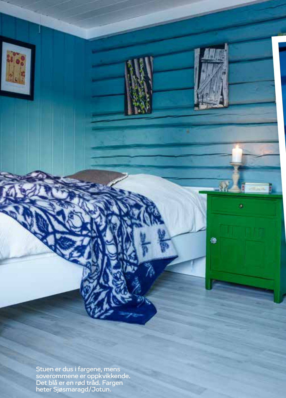
Stuen er dus i fargene, mens soverommene er oppkvikkende. Det blå er en rød tråd. Fargen heter Sjøsmaragd/Jotun.