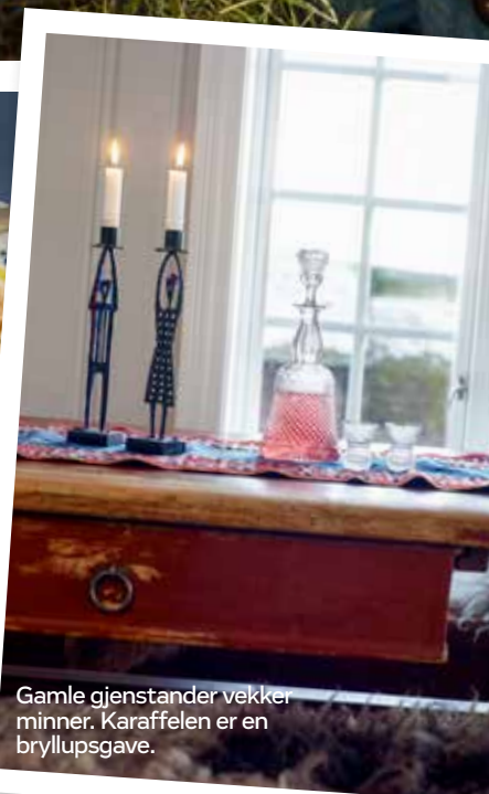
Gamle gjenstander vekker minner. Karaffelen er en bryllupsgave.