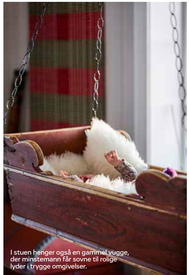
I stuen henger også en gammel vugge, der minstemann får sovne til rolige lyder i trygge omgivelser.