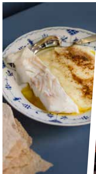
Torsk med rømmegrøt til er en klassisk tradisjonsrett i flere norske fjellbygder.