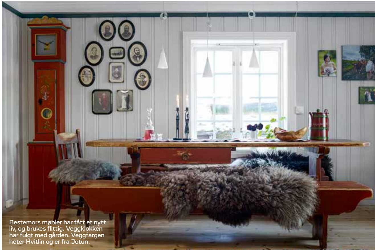
Bestemors møbler har fått et nytt liv, og brukes flittig. Veggklokken har fulgt med gården. Veggfargen heter Hvitlin og er fra Jotun.

Når vi kjenner historien til et møbel, er det som om omrisset blir vakrere.