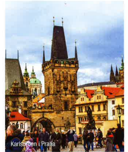
Karlsbroen i Praha