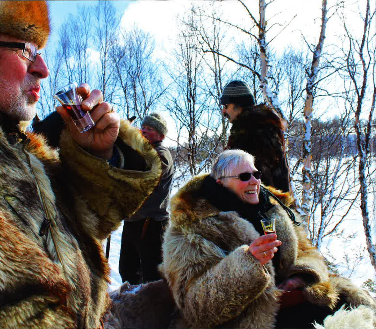
TYRKETÅR: På turen var det ofte tid for rastestopp, for bålkokt kaffe, spekemat og «tjukk-snip». Eller for en skål med de edlere dråper.